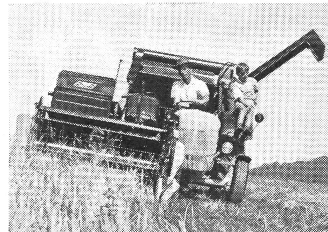
Grâce à son centre de gravité exceptionnellement bas, elle offre une sécurité maximum même dans les dévers atteignant 30 %.

Bureau de vente: 6318 Walchwil, Tél. 042 / 7 82 91