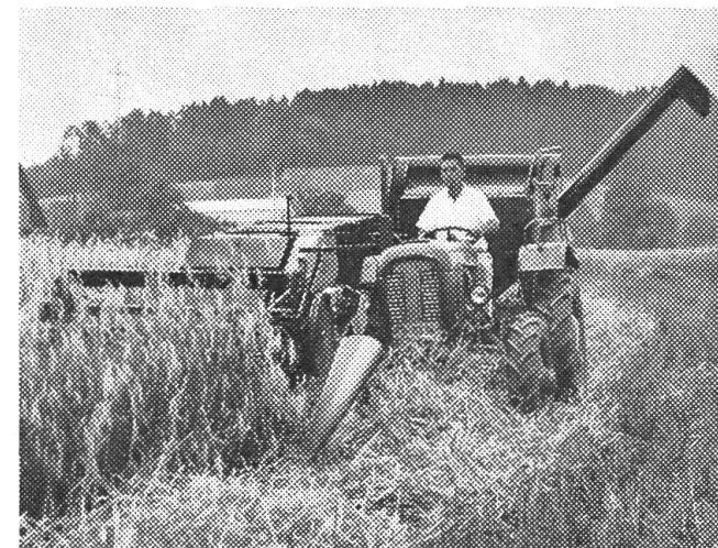
Tracteur et moissonneuse-batteuse forment une unité compacte. Le rayon de braquage, la maniabilité, la visibilité et la manipulation sont les mêmes que sur une moissonneuse-batteuse automotrice.