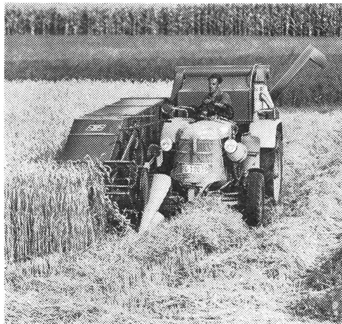
La moissonneuse-batteuse -JF- a trouvé un écho particulièrement favorable en Suisse en raison de sa bonne tenue en côte, de sa simplicité, de son très grand rendement ainsi que du nettoyage parfait qu'elle assure et de son prix de revient modique. Contrôlée par l'IMA.