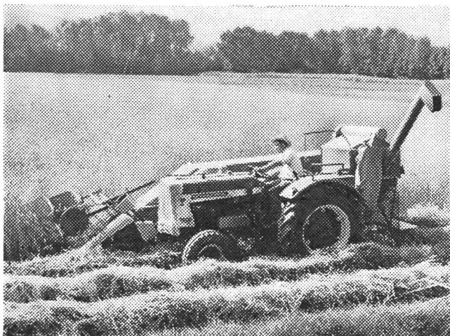
La longueur exceptionnelle du secoueur assure un nettoyage impeccable, notamment dans les terrains en pente.