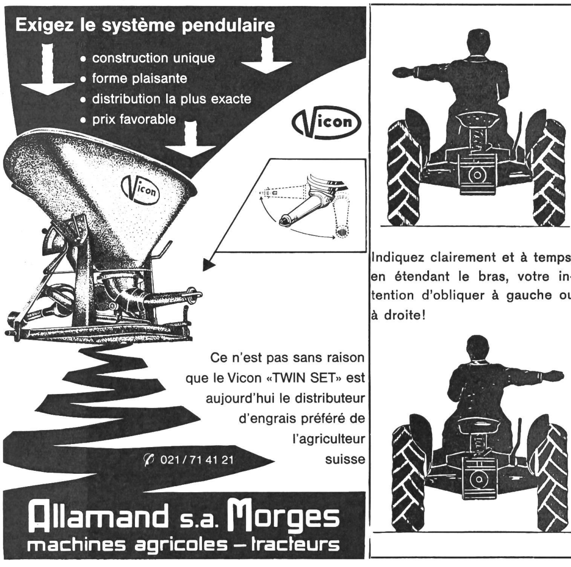
Illustration de la 1ère page de couverture

On peut constater régulièrement chaque année que les matériels défectueux ne sont amenés à l'atelier de réparation de machines agricoles qu'au tout dernier moment, soit juste avant de les réutiliser. Le réparateur se trouve alors surchargé de travail. Les pertes de temps et les ennuis causés faute d'avoir pris les dispositions nécessaires au moment voulu peuvent être facilement évités si les machines sont remises en état pendant les mois d'hiver!