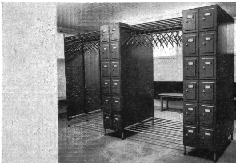
Fig. 5: Le vestiaire.