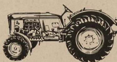
D 50 pour grandes entreprises

DEUTZ vous prouvera sa capacité de rendement par une démonstration sans engagement. Demandez des renseignements et prospectus à l'agent DEUTZ de votre voisinage ou à la représentation générale