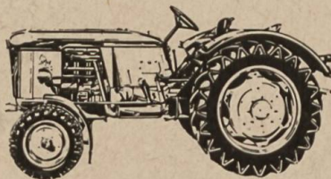
D 40 pour exploitations assez grandes