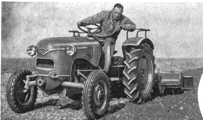
Fabrique de tracteurs E.Meili Schaffhouse