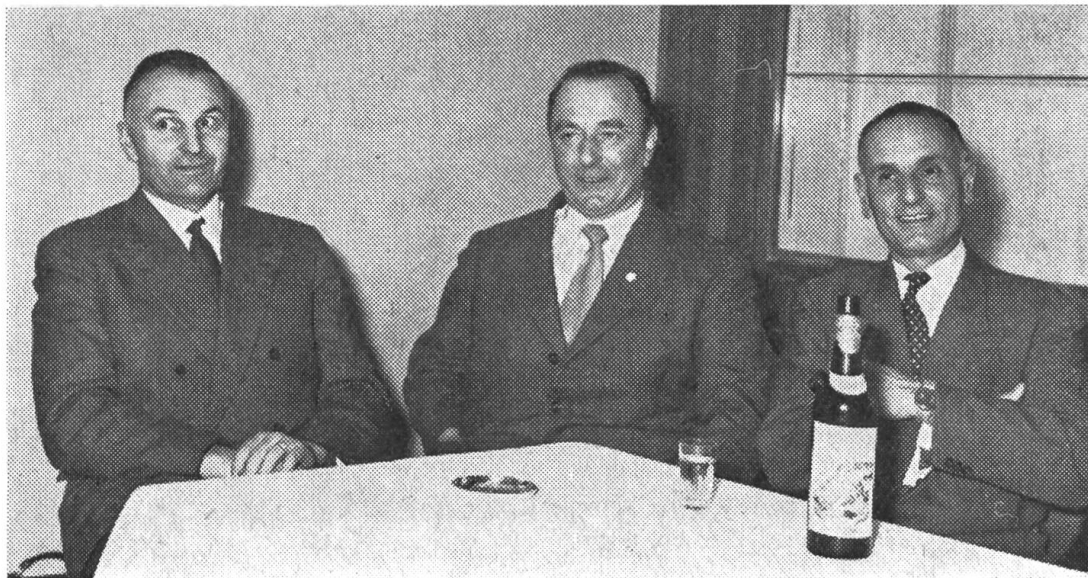
Les 3 présidents du Grand Con- seil de Zurich, Fribourg et Vaud

doise Accidents, qui était devenu nécessaire par suite de l'introduction de l'assurance-responsabilité civile obligatoire. A l'avenir, seules les primes concernant le personnel faisant partie de l'exploitation bénéficieront du rabais contractuel de 10 %. Pour ce qui est de la nouvelle loi sur la circulation routière, en particulier de la position spéciale du tracteur agricole prévue par l'art. 24, on fut prié de se reporter à ce qui a paru à ce sujet dans le numéro 12 du «Tracteur». Le numéro 9/1956 a fourni d'abondants renseignements sur l'opposition à cette position spéciale montrée par la presse automobile. Le rapport d'activité 1955/56, très détaillé fut unanimement approuvé. Il en alla de même du rapport financier 1955/56. Le programme d'activité, prévu pour la période s'étendant de novembre 1956 à novembre 1957, qui comprend 27 points ne fut pas accepté moins favorablement par l'organe souverain de l'association.