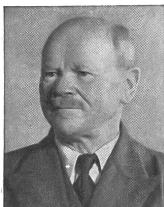
F. Laufer, Zürich