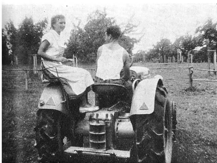
Le siège auxiliaire vu de derrière.

Au début, on n'était pas très au clair sur la forme que devraient avoir ces sièges et sur l'endroit où il fallait les placer. Diverses solutions étaient envisagées. L'apparition sur le marché suisse de tracteurs allemands équipés de sièges auxiliaires sur les garde-boue des roues arrière fit bientôt voir qu'une telle solution était probablement la meilleure. Il semble effectivement que ce soit le cas. Quoi qu'il en soit, il y a cependant lieu d'user de prudence lors-