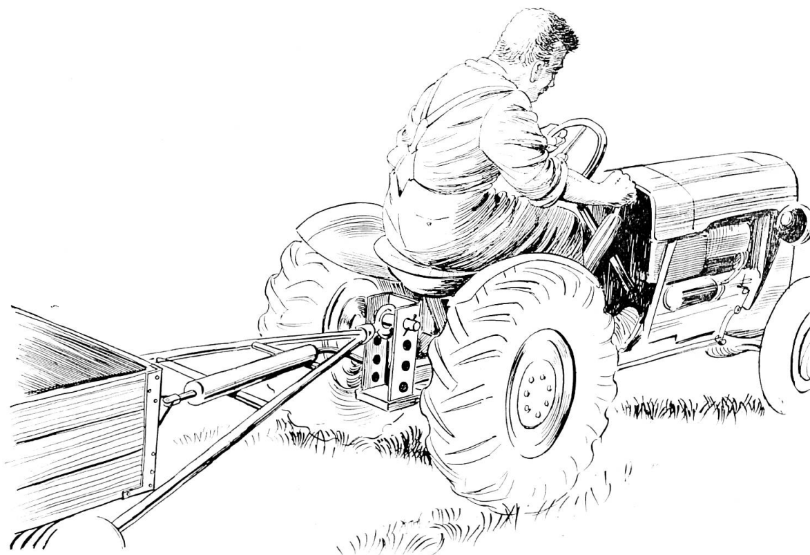
Fig. 1: Le dispositif de commande hydraulique Tétrax 303 pour freins de remorque mécaniques garantit une sécurité entière pendant la marche. La remorque est freinée sûrement et sans peine depuis le siège du conducteur.