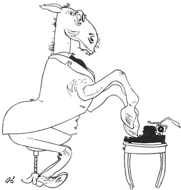
Par ce dessin, le «Nebelspalter» (revue satirique de la Suisse alémanique) fustige chaque fois les vexations de la bureaucratie.

Les lecteurs du «Tracteur» savent très bien que je ne fais preuve d'aucune indulgence à l'égard des vexations des administrations publiques. Il ne s'agit alors pas du tout, pour moi, de «rouspéter» purement et simplement, mais bien davantage de signaler les tracasseries et les abus de la bureaucratie.