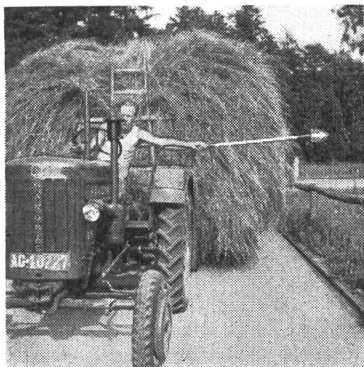
Conducteur de tracteur avec un bâton de signalisation (vu de devant).

Lorsqu'on veut obliquer à gauche avec un char de récoltes lourdement chargé, il est très facile de signaler son intention au moyen d'un bâton muni d'une flèche de direction.