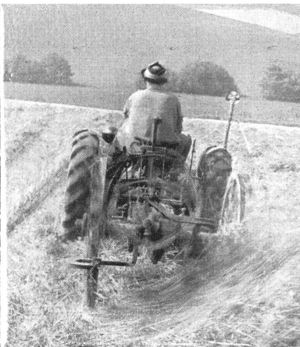
Fig. 2. L'arracheuse à pommes de terre utilisée comme épandeuse.