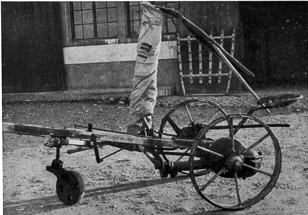
La barre de coupe est protégée contre l'humidité