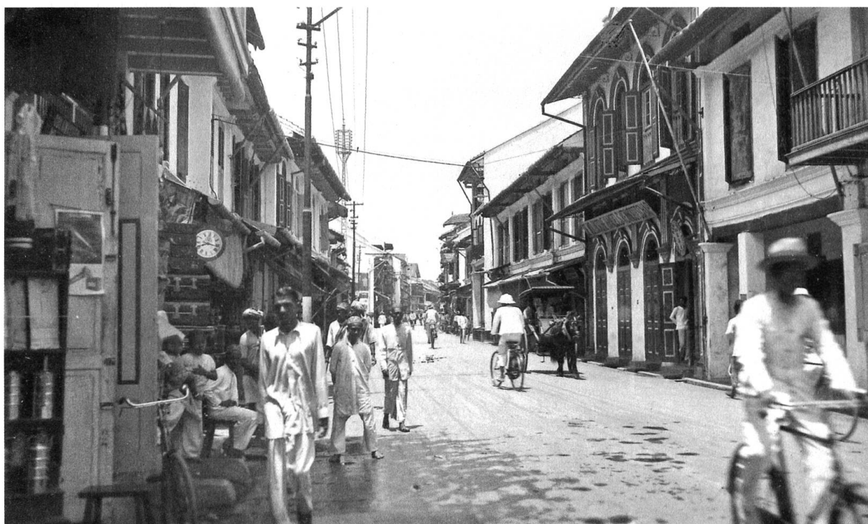
Abb. 3: Die «Passarstraat» in Makassar, Aufnahme von 1928.