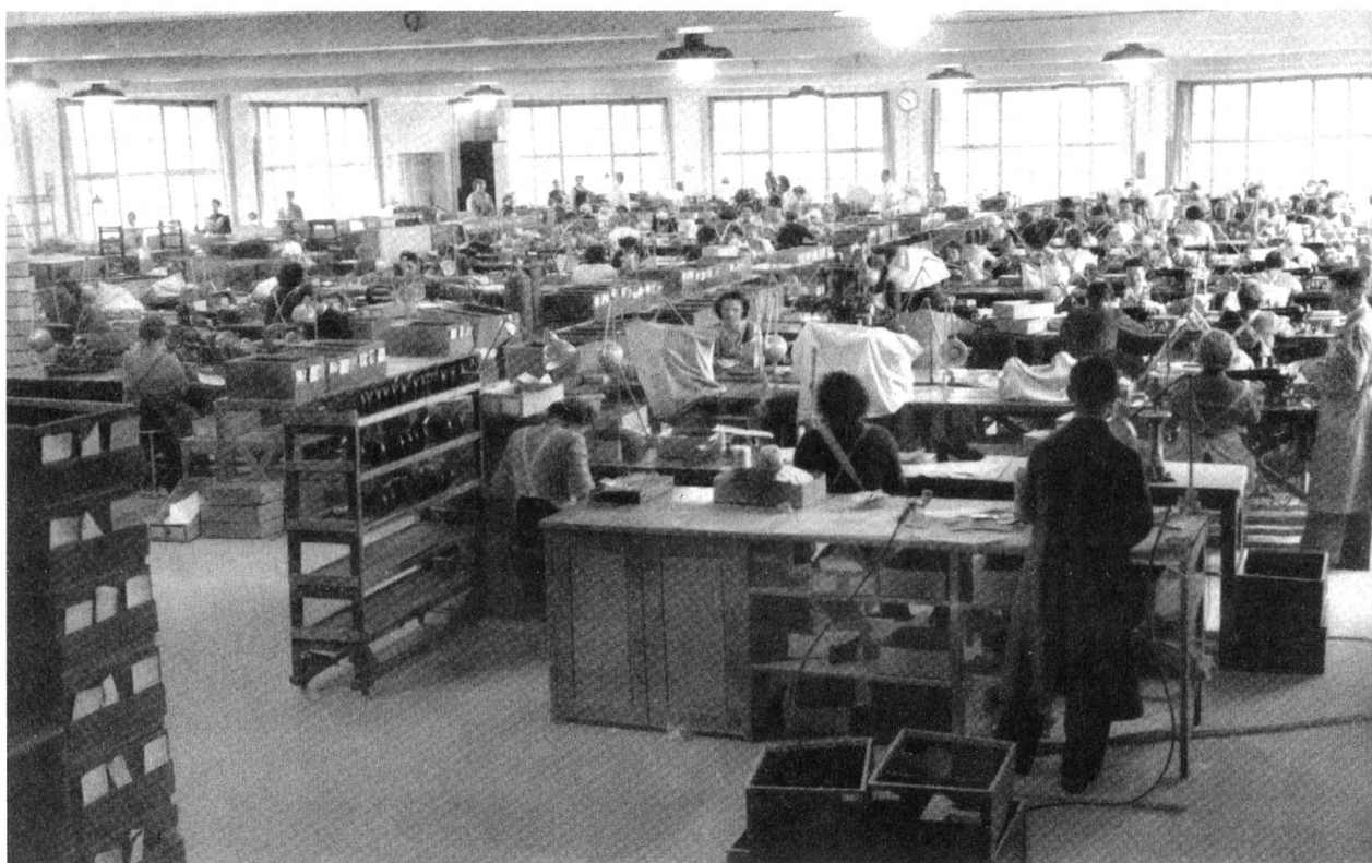
Abb. 18: Frauen – oft ungelernte Arbeiterinnen – in der grossen Näherei der Firma Löw.