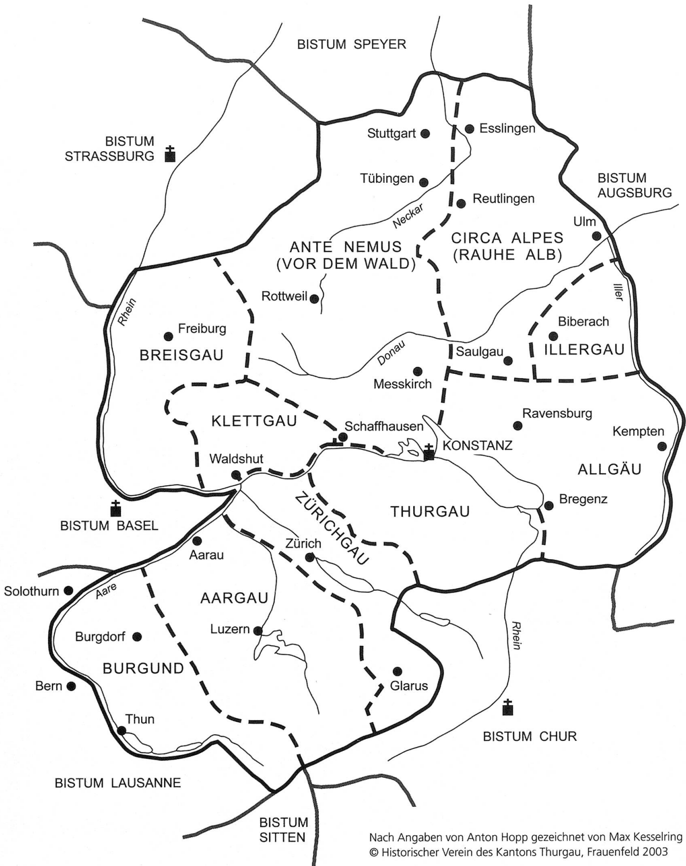
Karte 1: Archidiakonate im Bistum Konstanz 1275