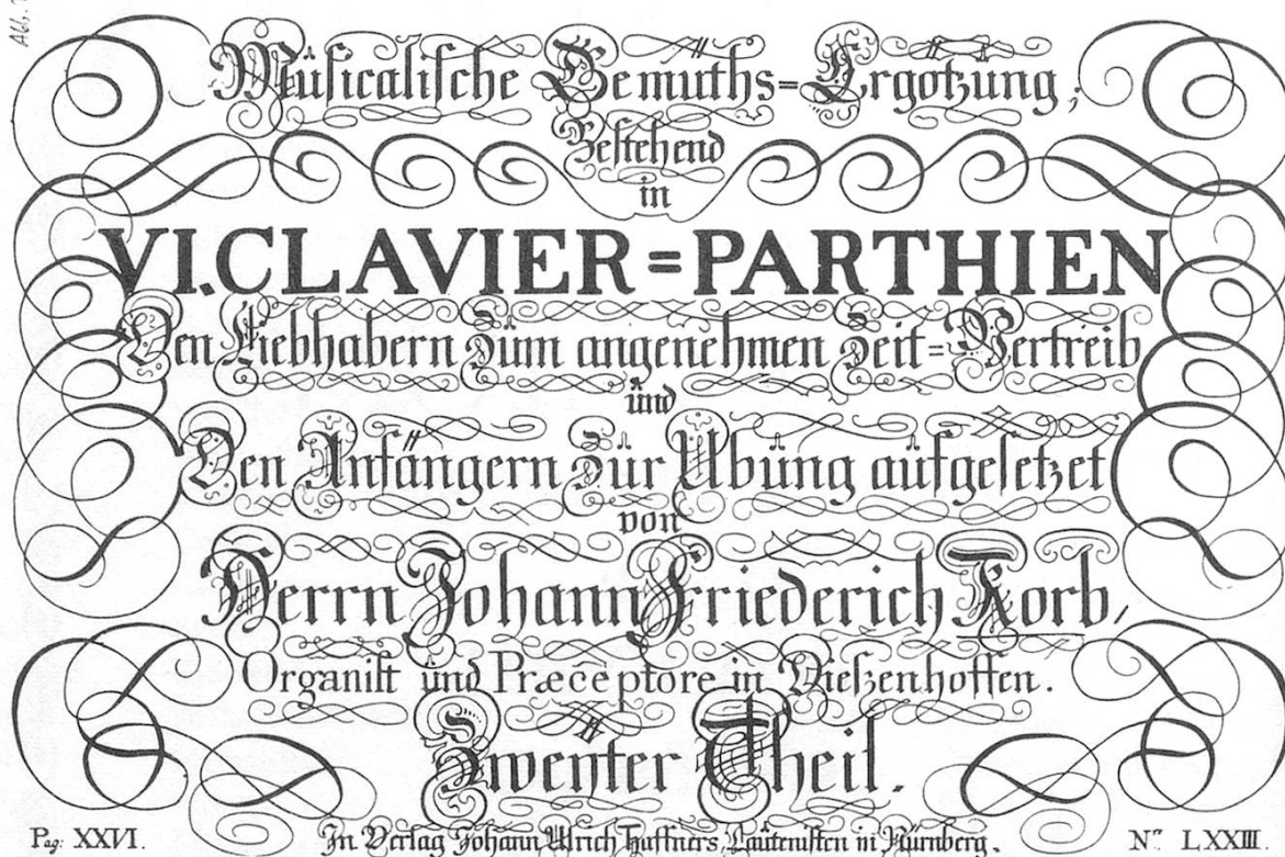
Abbildung 2. Titelblatt der 1756 in Nürnberg gedruckten «Musicalischen Gemüths-Ergötzung» von Johann Friedrich Korb. Original in der «British Library» zu London.