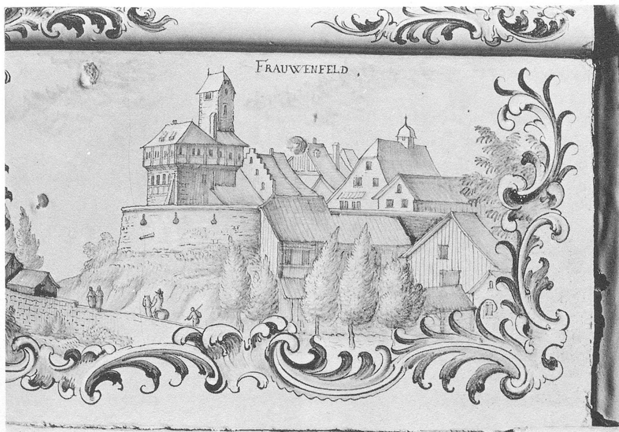
Abb. 1. Ansicht der Stadt von Süden. Kachel an einem Ofen in der Schipf Herrliberg, Zürich, 18. Jh.

von Westen eher wie ein Satteldach wirkt, bei den Ansichten von Süden hingegen als Kropfwalmdach erscheint. Es wurde vom Uhrtürmchen gekrönt, das im 16. und 17. Jahrhundert einen mit glasierten Ziegeln gedeckten Spitzhelm trug; später, wohl 1733, wurde dieser durch eine kupfergedeckte Zwiebel ersetzt.