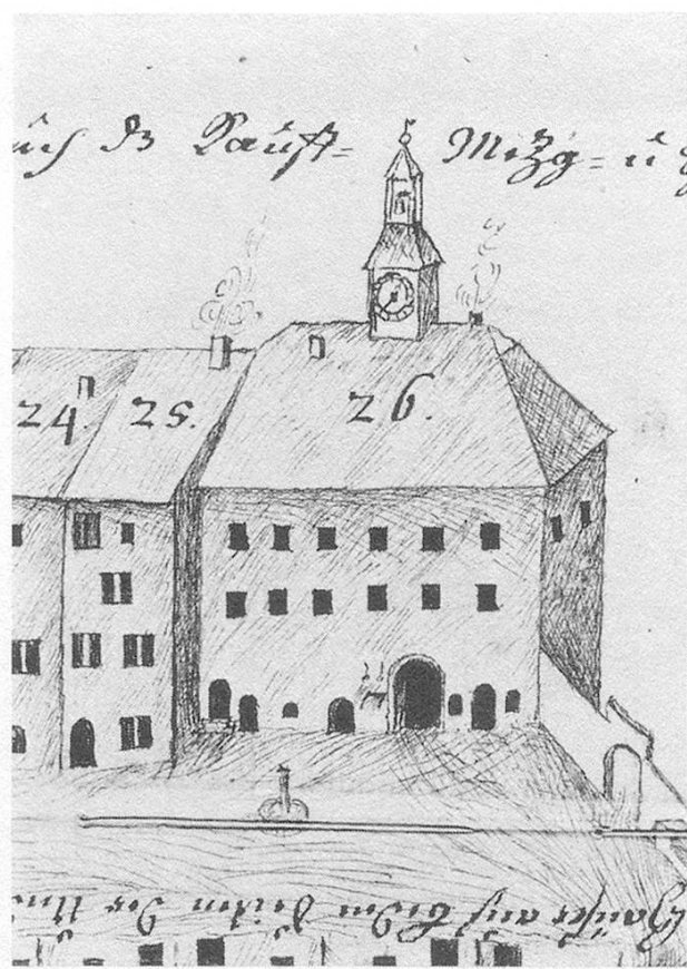
Abb. 3. Rathaus von Westen. Ausschnitt aus dem Gassenprospekt. Gebäude Nr. 26 «Ist das gemeinsame grosse Rathaus, wie auch das Kauff- Mezg- u. Schmalzhaus».

Liter Korn) erhalten sollte. Zu Fronarbeiten zeigten sich die «Underthanen gantz geneigt». Die Arbeiten wurden unverzüglich ausgeführt, und viele Handwerker trugen das ihre dazu bei.