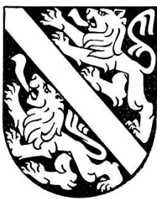
Das Wappen des alten Thurgaus vor 1798, vom Historischen Verein als Abzeichen angenommen. In Rot goldener Schrägbalken mit zwei goldenen Löwen