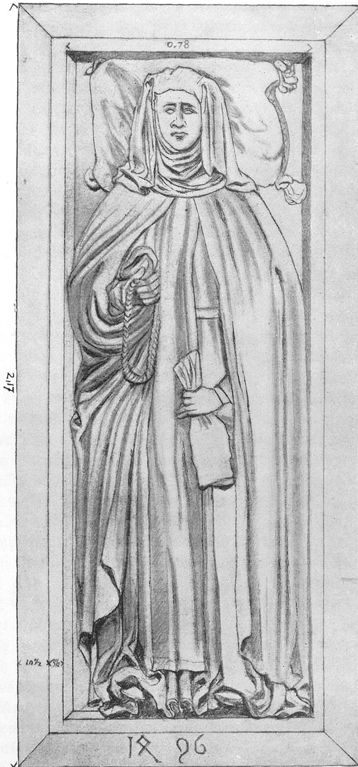
Kenotaphium der hl. Ida vom Jahre 1496.

(Aus: J. R. Rahn. Die mittelalterlichen Architektur- und Kunstdenkmäler des Kantons Thurgau.)