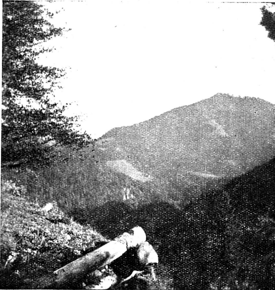
DE WÄLSCHBERG VOM TIERHAG US GSEH

Behördl. bewilligt am 19. 2. 42 Nr. 6384 BRB 3. 10. 1939