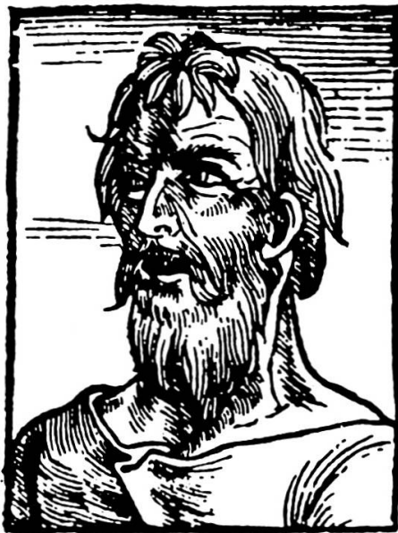
Bruder Klaus, aus der Schweizer Chronik von Johannes Stumpf, 1548