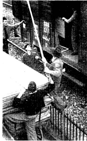
E ganze Ysebahn- wage voll Kulisse u Chischte ghört zur Uusrüchtig vo der «Heidi-Bühni»!