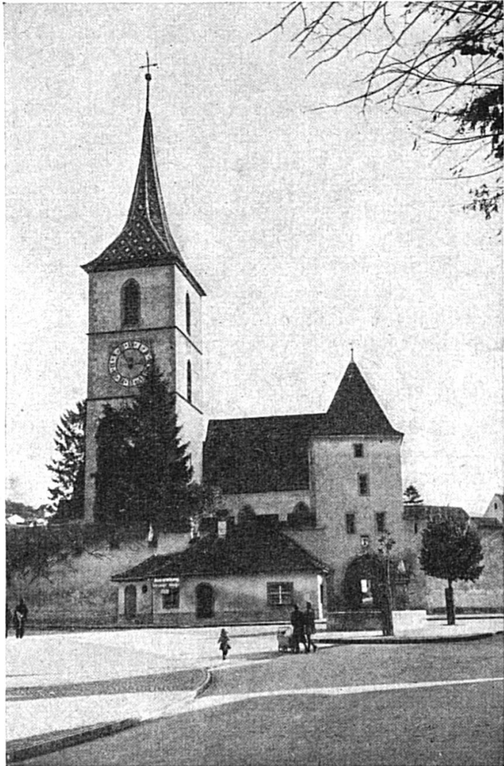
Die befeschtigi Chilche z Muttez (Muttentz)

Nit lang ischs gange so het dä Jung alles versilberet, isch vo deheim furt, in es frönds Land und het dört sys ganz Vermöge higmacht.