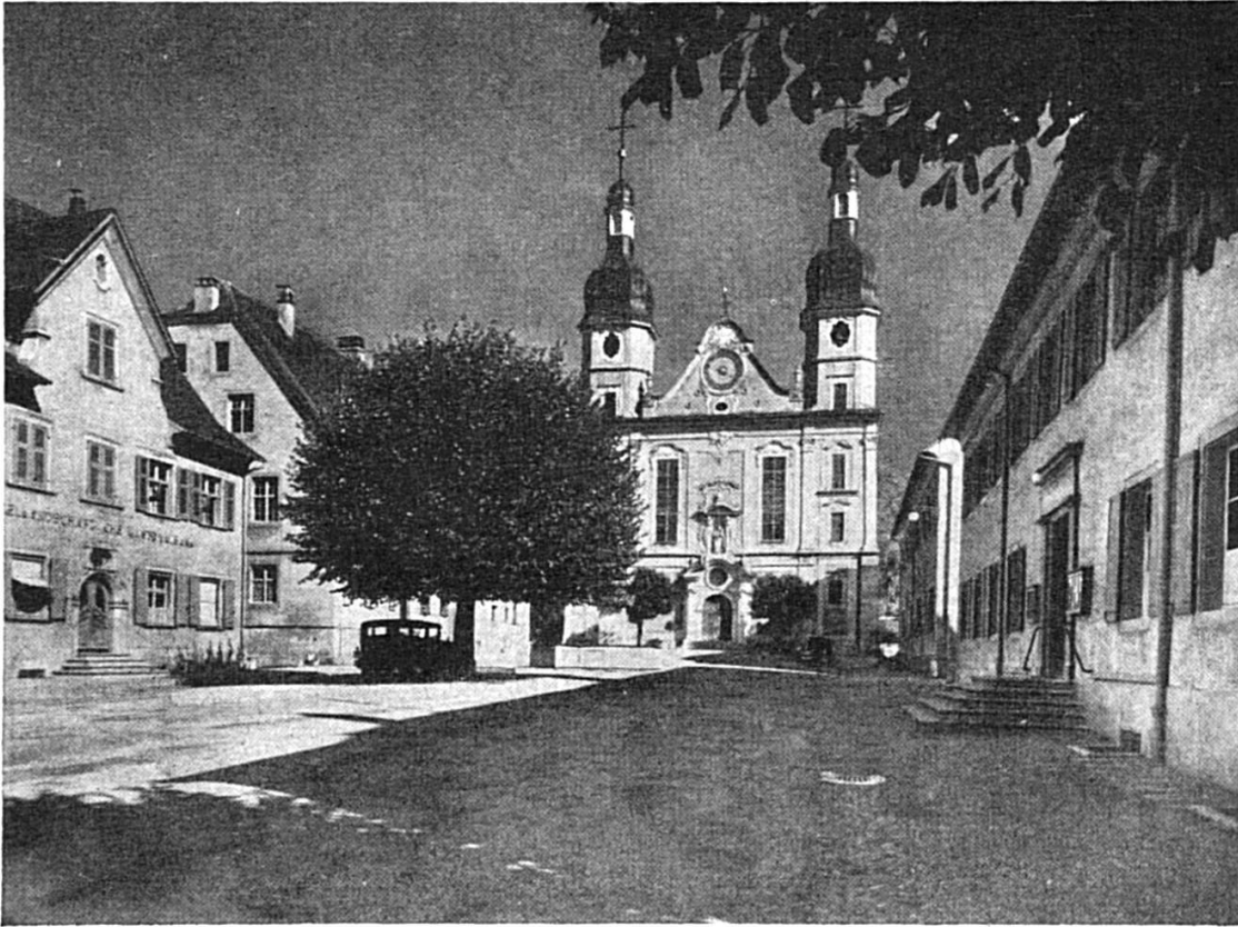
d Domchilche und Domheerehüser z Arlese (Arlesheim)