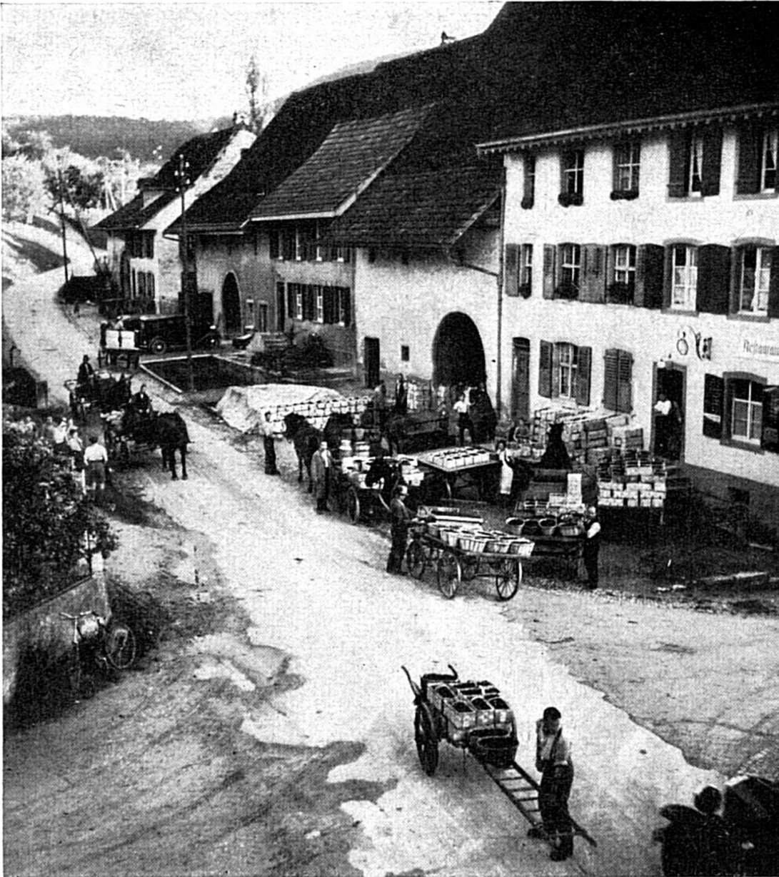
Chirsi für di ganzi Schwyz (Arisdorf)

gsi. Jä, so eis isch das chly, härzig Fraueli gsi. «S isch schaad gsi», so het eus d Mueter no wyter verzellt, «ass der Vater so gly gstorben isch, i glaub mer weere no rych worde. D Groosmueter isch vill zgiibig gsi, si hät s Hemmli vom Lyb non äwägg gee und mer hai öbbe derwääge mit ere balget. In der Wirtsstuube het si zu den arme Schlucker gsait: «S choschtet nüt, will dirs syt» und in die armselige Huusholtige, wo grad e Chindbetti ummegsi isch, het si im Lädeli s Nötigscht zäämegruumt, s under e wyte Schurz packt und im Verschmeukte dörthi gschleipft. Deis isch natürlig uff d Längi nit gange, me het s Wirte und s Lädeli uufgee, in die groossi Stuube sy zwee Pasimäntstüel gstellt worde und d Rääbe hai au nüm so guet do und sy nodisnoo uusgmacht worde.» So het eus d Mueter män-gisch verzellt.