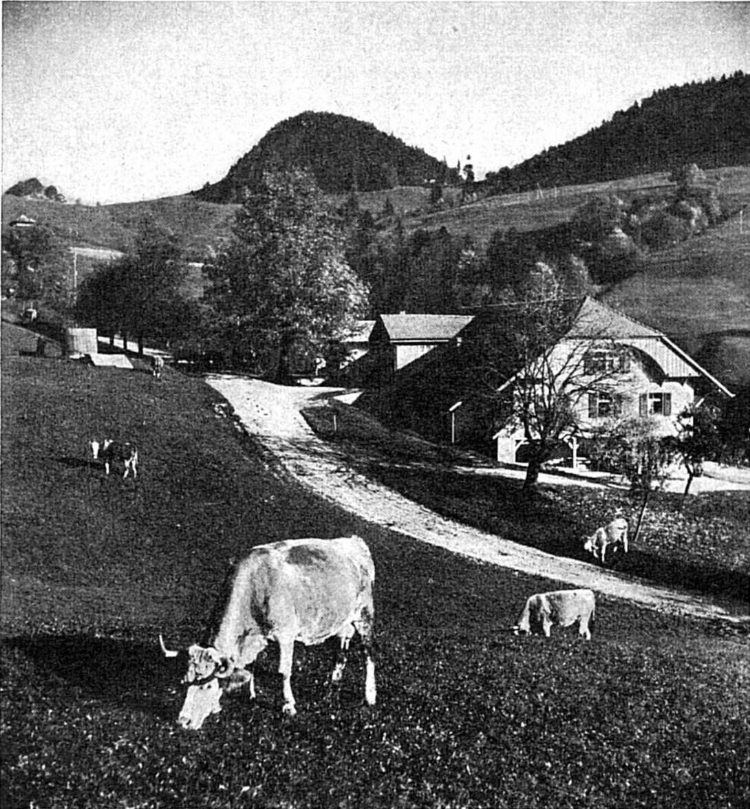
Bym Chilchzimmer z Langebruck

Jä, und won i derno us im Grossholz uusen und wider hai bi, isch mer erscht rächt so Zügs dur e Chopf gschosse — gwüs wien e Huufe Träum. Pasimäntermaitli han i gseh, wo für emängs z Sorge hai und nit emol es «Dankgerschön» überchöme — im Gegetail, nüt as ais Gäk und Gwöi, nüt as dai hämisch Ton, wo vernüetelet. Numme, ass si au wüsse, wie gring me se schetzt und wie men uf sen abeluegt. Ummeziemandli, Chnächtli, Fabrikler han i gseh, wo niemer für ärscht nimmt, wo dur s Läbe gönge — wie öppis, wo gar nit zellt. Und über all Gränzen uus han i gluegt und derby Möntsche gseh, wos glych hai wie dais Tandli im Grossholz und wäge däm eerger drasy weder die merschten arme Tierli. Und juscht bi dene Zyleten und Hüüfe han i ganzi Zyleten und Hüüfe vo dainer Sorte gewahrt, wo wie die höche, grade, schöne, gesunde, starche Tannen i der