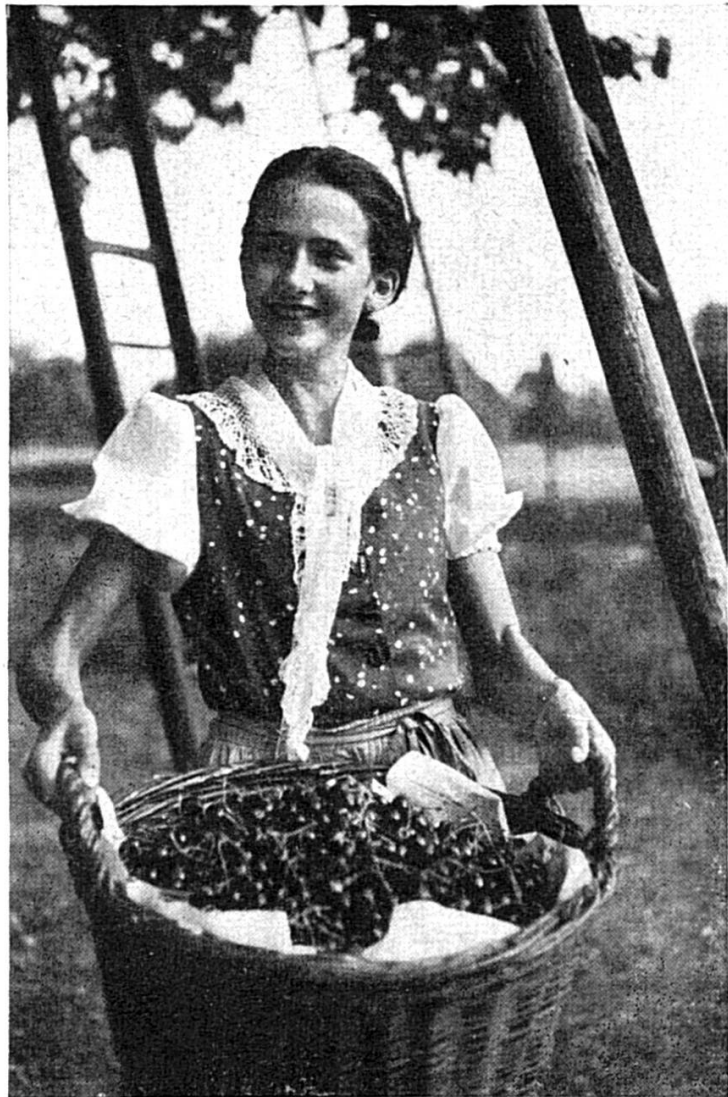
Dunkli Chirsiaugen und schwarzi Baselbieterchirsi