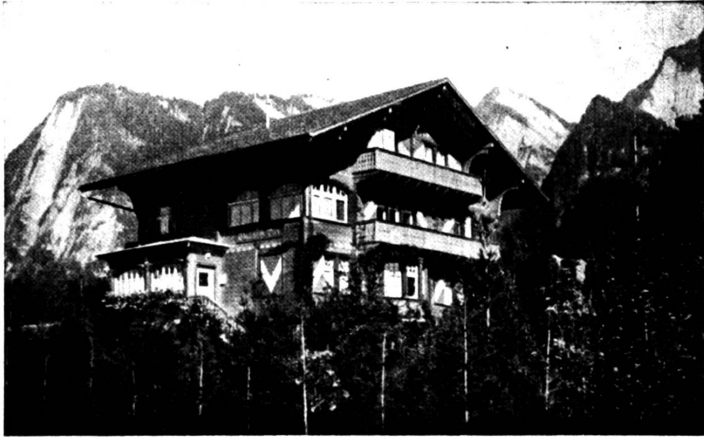
Ds Hei vom Chrüterpfarrer z Zizers