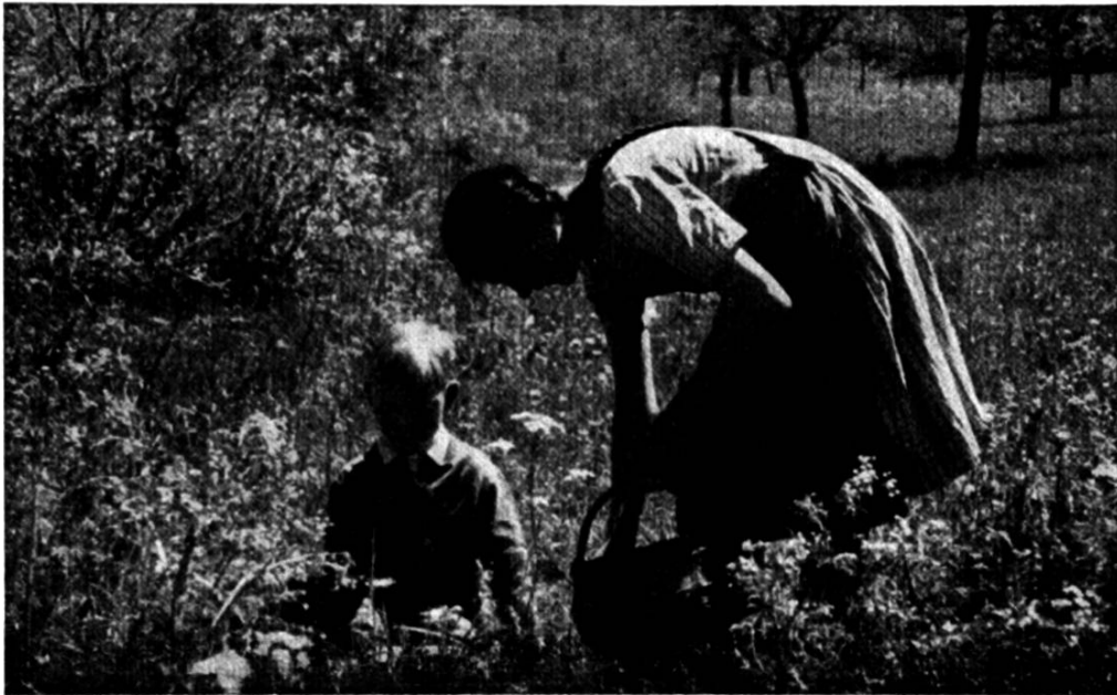
Chind bim Chrütersammle