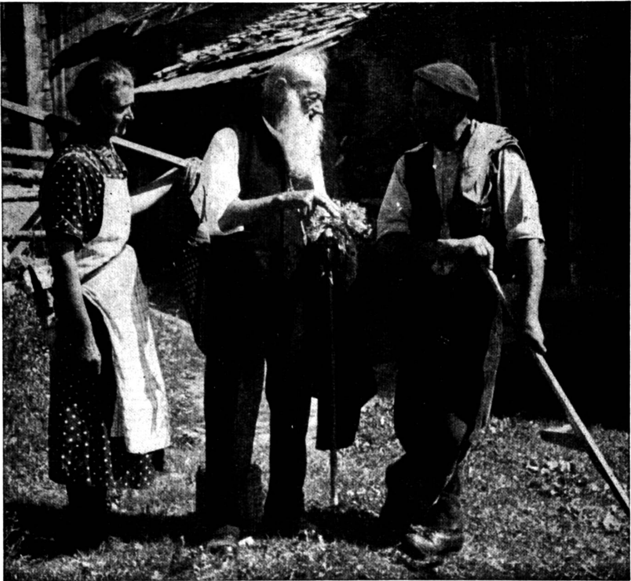
Der Chrüterpfarrer het's mit em Volch guet chönne

mool lieber mit de Tierli gkaa als mit de Mensche, mit mim Büsi und mim Hond. Mini Freud send d Blueme gsii und min Gaarte, de Holder und d Hagebutte, i ha mini bekannt Früehligskuur au selber gmacht. I bi früeh ufgstande und früeh is Bett gange, i ha eifach gesse, wenig Fleisch und vil Gmües. Und woni elter worde bii, hani au mis Gläsli Wii trunke, aber höchstens e Zweierli im Taag. I ha au regelmääßig min Stompe graucht, das isch guet gege Verdauigs-Stöörige, hät er gseit. Und i bi vil spaziere gange, zwei Stond und meh im Taag. Und bis zum 70. Jahr bini i d Berg gange und ha mini Freud gkaa a de Flora, a de Murmeli, wo pfeffe hend, a de eifache Sene und a de flinke Gemse. Ales ander ischt Gnaad und Gschenk vom Herrgott gsii», so hät er gseit.