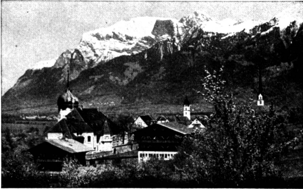
Zizers, im Bündnerland

eme flotte Mehr för di frei Praxis und för de Chrüterpfarrer entschide. A dem Taag hends de bäartig Pfarrer-Dokter, wo sich ebe damool kein Baart gholt hät, mit eme bekränzte Wage im Triumph a de Bahn abholt und heigführt.