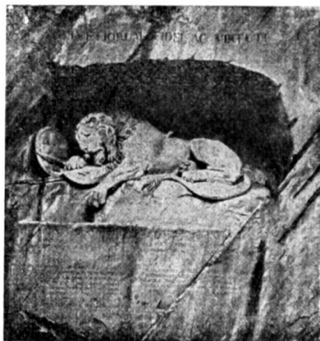
Luzärn: z Leuedänkmol