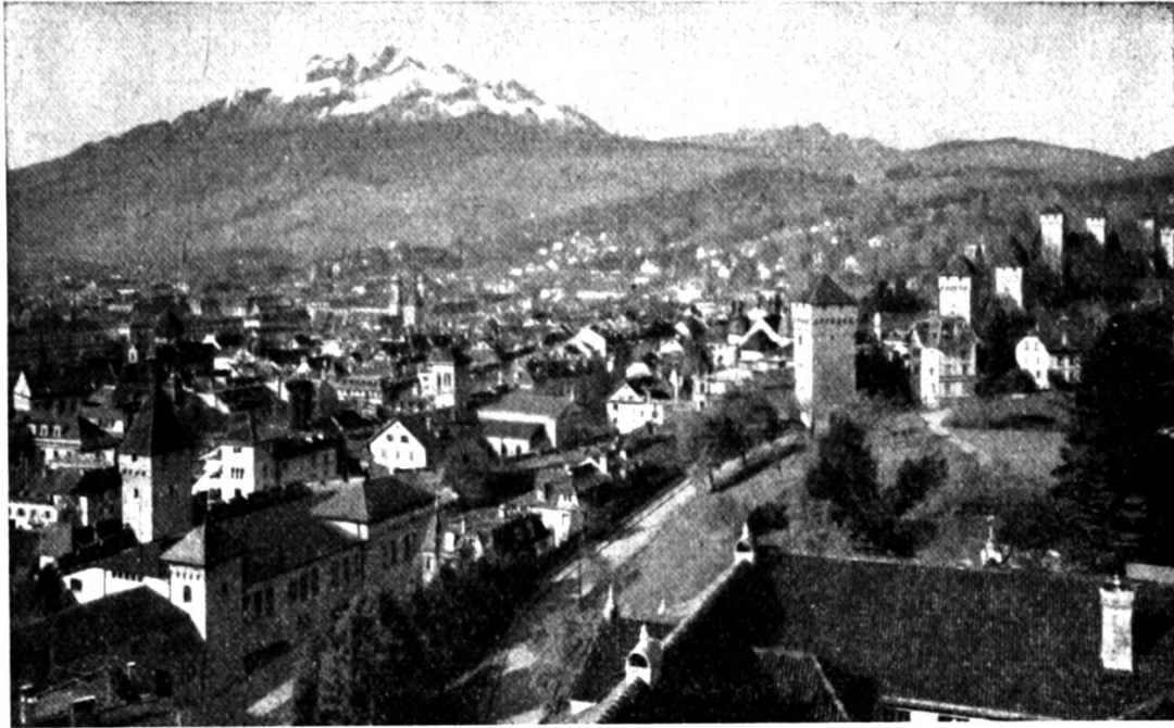
[ Luzärn mit em Pilatis