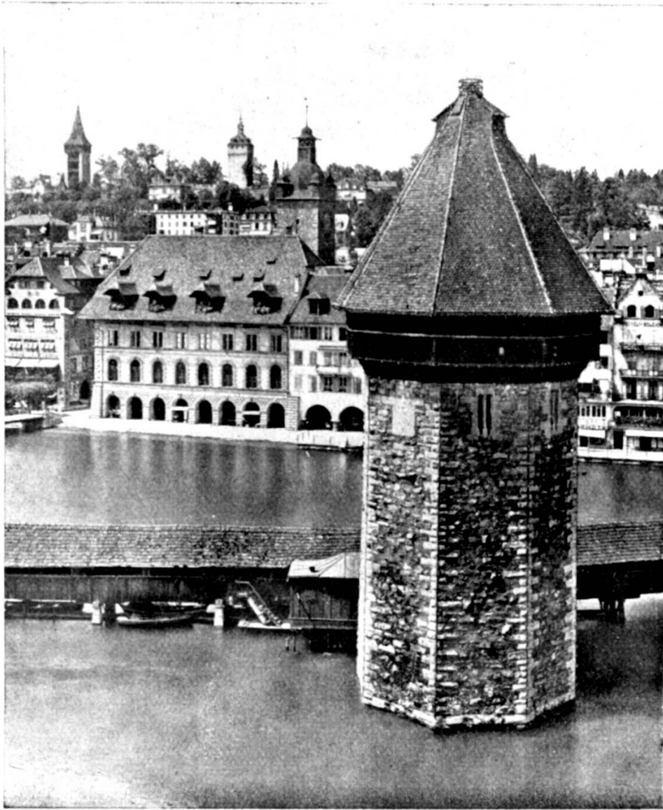
Luzärn: Wasserturm und Rodhus