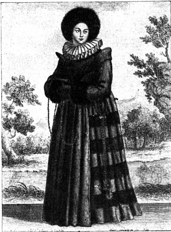
Solothurner Bürgersfrau 1650

vor-a-foh! — Aber nit no loh gwinnt! Und wo-n-i mini Sache im Pfarrer ufgseit ha, het's g'heiß: Recht so, Hans! i ha nit gment, aß so brav lehrisch! Und er het m'r nes großes Glas Wi igschenkt und ne Bitz Wißbrod d'rzue abghaue. Und am Ostermäntig het's mi dunkt, i sig schöner agleit, as d'r König vo Frankrich: funkelneu Pechschueh, nes ristigs Hömli und ne ganz halblinige Bchleidig mit gäle, möschige Chnöpfle dra, und ne neu Tellerchappe mit eme große lederige Dächli. Und s'Madlungeli isch au cho luege, wie-n-is mach i d'r Chilche und d'Meisterne au. Und wo's usgsi isch, hei m'r i s'Wirtshus chönne und d'Meisterne het ne Halbi Rote zahlt und Züpfe d'rzue, und d'r Pfarrer het m'r ne große schöne Helg gäh, und wo-m'r d'r Berg uf si, ha-n-i gjutzget und gsunge und ne Freud gha, sider keini meh e so, mir Lebzig nit!