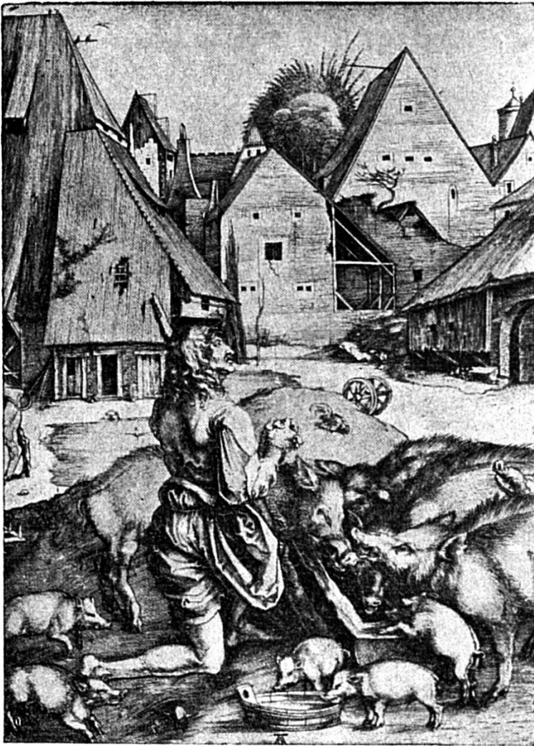
Der verlore Sohn vom Albrächt Dürer

Do sy mym Bürstli endlige d'Auge wie- der ufgange! Und er isch innen selber ggange und zunem selber gsät: i s'Va- ters Huus isch so mänge Chnecht, und alli hei Brod, meh as gnue, und ih mueß do z'Grund goh vor Hunger!