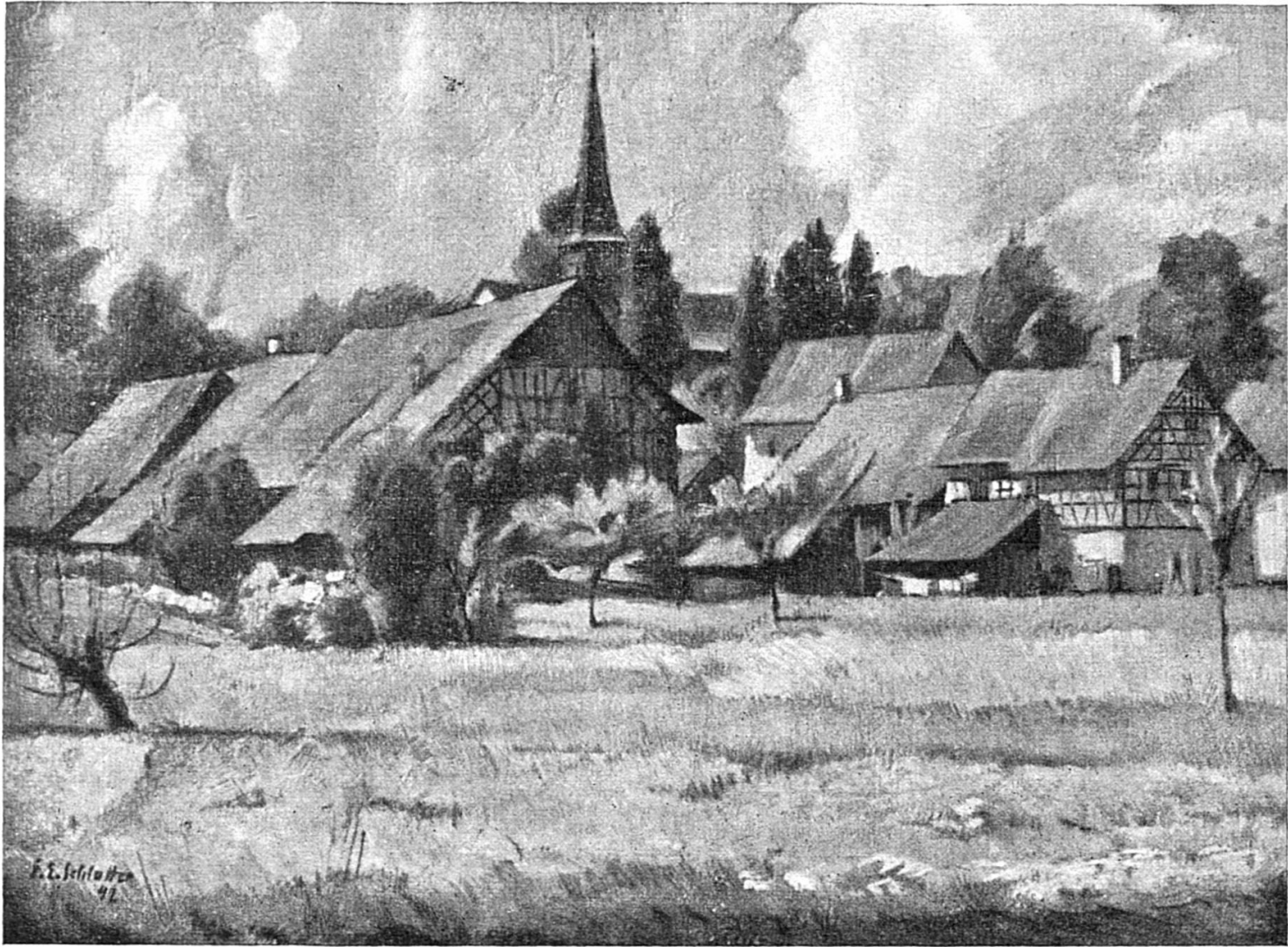
SCHLATTINGE, Gemälde vom Ernst E. Schlatter.