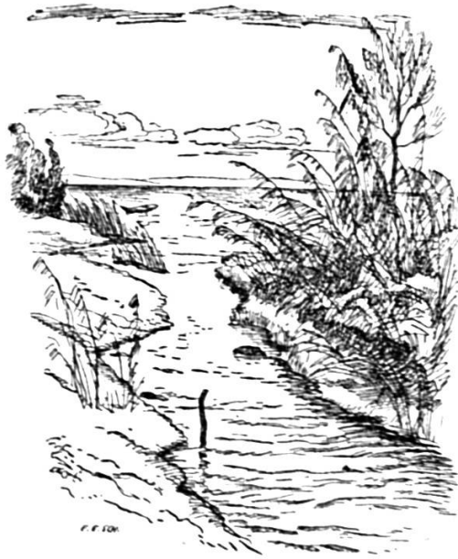
Federezeichnig vom E. E. Schlatter

Wo de Schär emol bim Schtacher z'Hagebueche überhogget ischt, hät en sin agne Schwigersoo, wo zu de säbe Zit grad Landeger gsi ischt i där Gegeg, müese ufschriibe. De Toggter froget, wa denn da choshti wemes grad bar zali. En Füfiber, hät de Bschaad glutet. De Toggter git emm 2 Füfiber ond saat: Du häsch denn s'Wiberguet grad au scho!