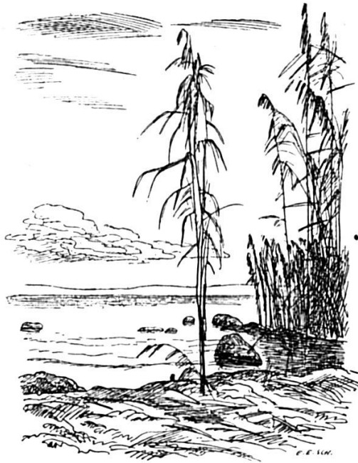
Federezeichnig vom E. E. Schlatter

Bim Schtäli z'Hagebueche häts emol mit ere Chalberchue öd well vorwärts go mit Chälble. Er hät drom de Toggter cho lo. Dä ischt vorne o d'Chue ane gschtande, de Schtäli hene ane, ond Beed hond die Chue oogluet, aber vo dem hät si halt au öd chöne chälble. Do saat de Toggter: Neet mi gär öd Wnnder! Wenn d'Chue omelueget, so maant si äbe, s'Chalb sei scho do.