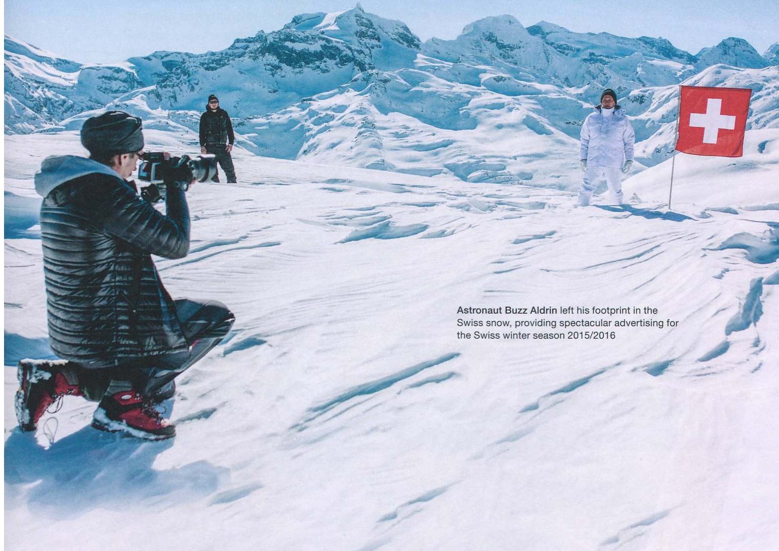
Astronaut Buzz Aldrin left his footprint in the Swiss snow, providing spectacular advertising for the Swiss winter season 2015/2016