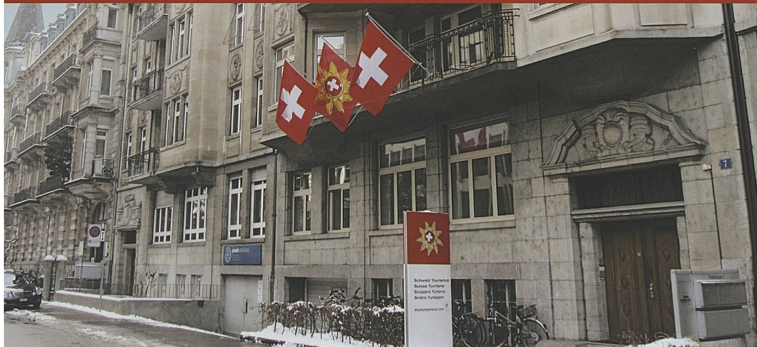
Svizzera Turismo ha rappresentanze in 20 Paesi. La sede centrale di Zurigo, nella Tödistrasse, tiene le fila di tutto. Switzerland Tourism is represented in 20 countries. The nerve centre is the headquarters on Tödistrasse in Zürich.