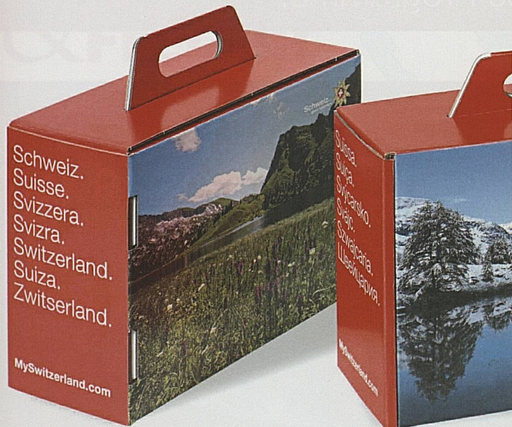
Piena di cose svizzere: la valigetta promozionale. Packed with Swissness: the promotional package.