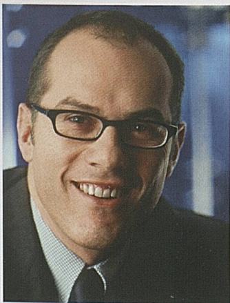
Jürg Schmid, direttore di Svizzera Turismo CEO, Switzerland Tourism