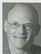
Urs Emch Marketing Marketing prodotti leisure, supporto pubblicitario & produzione, fiere & manifestazioni, Enjoy Switzerland