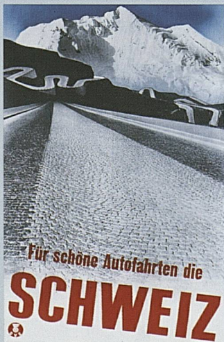
Herbert Matter. For beautiful car journeys choose Switzerland, 1935

If we look back over almost 85 years of promoting Swiss tourism, we see both change and consistency. At the beginning stand our legendary mountains, as depicted by the 1921 «Summer in Switzerland» poster designed by the artist Emile Cardinaux. The mountains