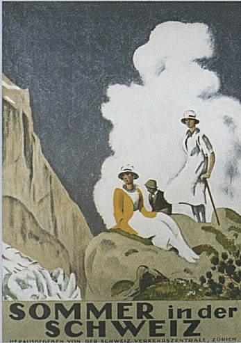
Emile Cardinaux. Summer in Switzerland, 1921