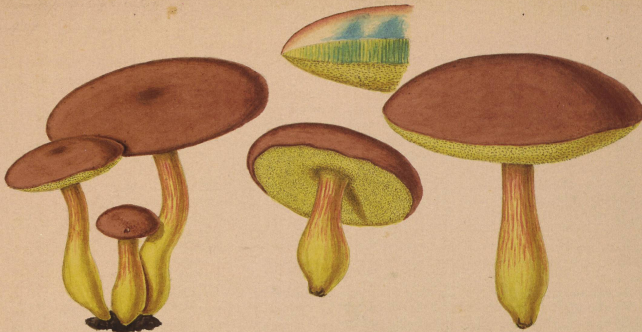
Boletus pruinatus . Fr.