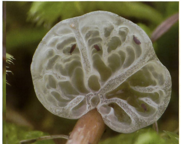
CAMPANELLA CAESIA Fructifications | Fruchtkörper