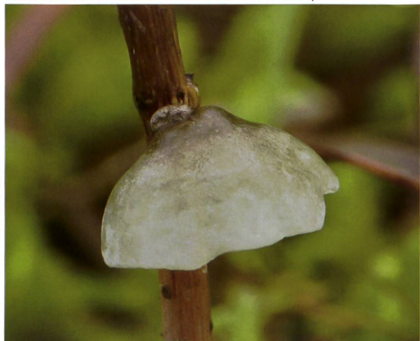
CAMPANELLA CAESIA Fructifications | Fruchtkörper

Il semble que cette espèce ait maintenant dépassé la zone côtière et progresse vers le continent. J'ai réussi à découvrir la première récolte pour l'Alsace (Petite Camargue Alsacienne, en contrebas de Bâle) le 17 octobre 2014. Elle a été sui-