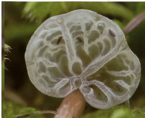
CAMPANELLA CAESIA Fructifications | Fruchtkörper