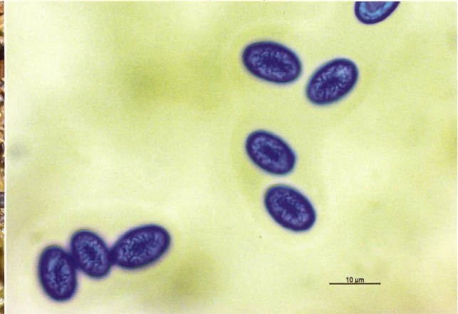
PSEUDOMBROPHILA RAMOSA Spores | Sporen