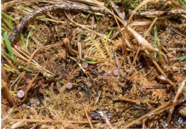
PSEUDOMBROPHILA PETRAKII Fructifications | Fruchtkörper