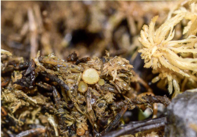
ASCOBOLUS LIGNATILIS Fructifications | Fruchtkörper