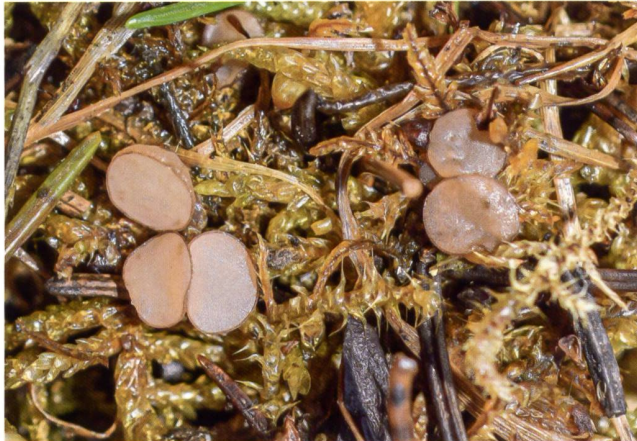
PSEUDOMBROPHILA RAMOSA Fructifications | Fruchtkörper