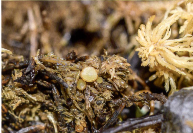
ASCOBOLUS LIGNATILIS Fructifications | Fruchtkörper