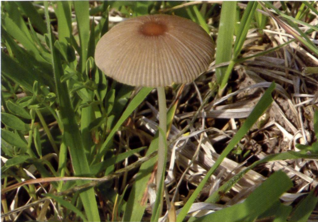
PARASOLA AURICOMA Braunhaariger Tintling | Coprin à soies brunes

Ort ist noch nicht festgelegt! – Sonntag–Freitag, 28. August–2. September: Pilz-Studienwoche im Antoniushaus in Morschach, Kt. Schwyz, Organisation: Ivan Cucchi. www.pilzverein-zuerich.ch