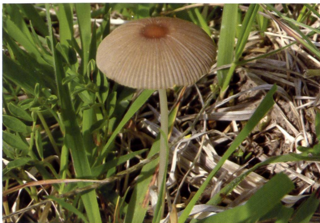
PARASOLA AURICOMA Braunhaariger Tintling | Coprin à soies brunes