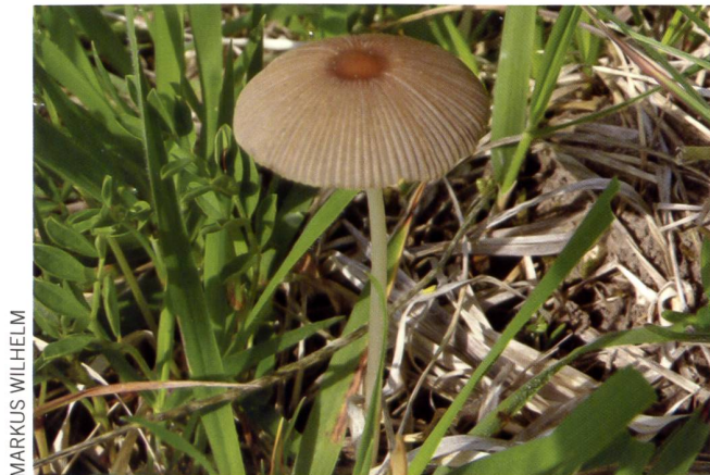
PARASOLA AURICOMA Braunhaariger Tintling | Coprin à soies brunes