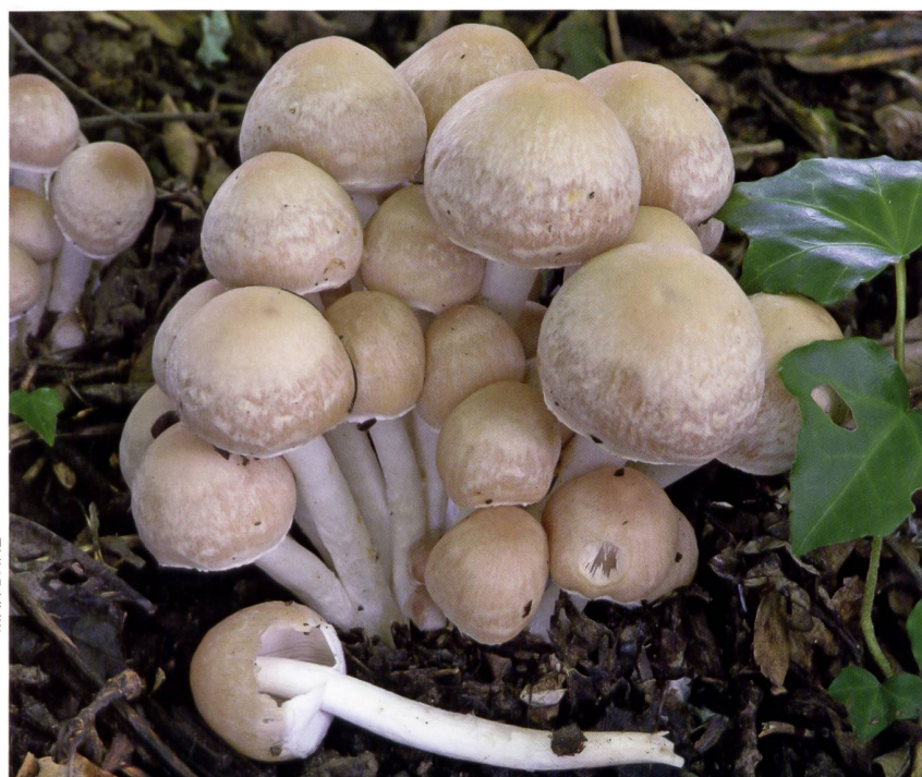
PSATHYRELLA CANDOLLEANA Behangener Faserling | Psathyrelle de De Candolle