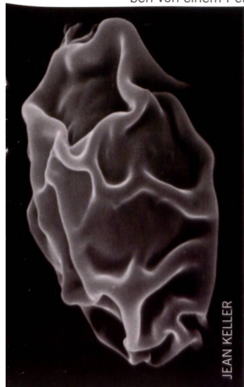
Abb. 12 Steifstieliger Faserling