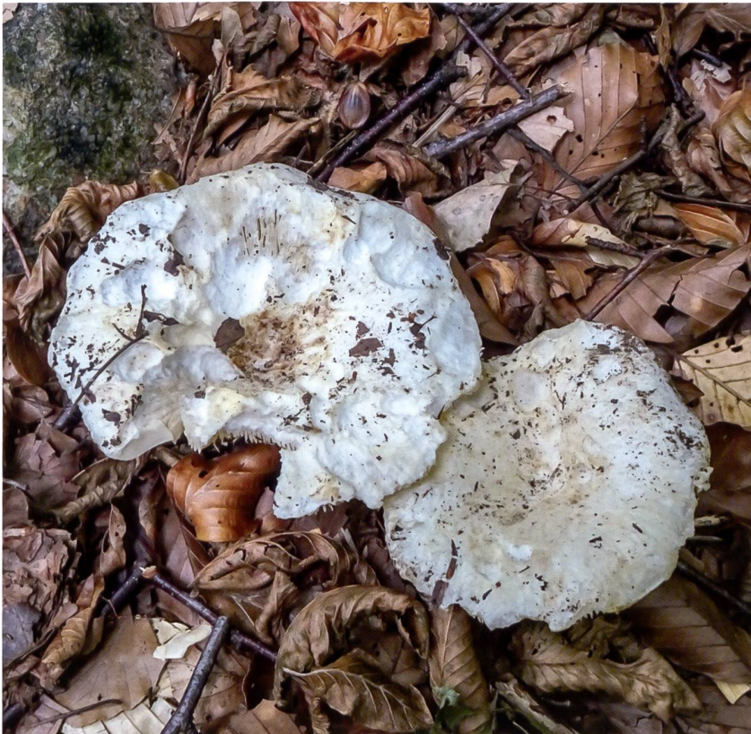
RUSSULA FLAVISPORA Esemplari in habitat | Fruchtkörper am Fundort