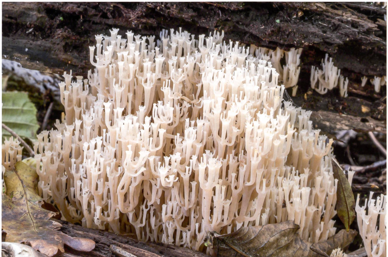
ARTOMYCES PYXIDATUS Fructifications du champignon dans son milieu | Fruchtkörper am Fundort

Pyxis: ist ein antikes griechisches Gefäss. Cladonia pyxidata ist eine häufige Flechtenart auf Totholz, die im oberen Teil kleine trichterförmige Fruchtkörper (1–2 cm) besitzt.