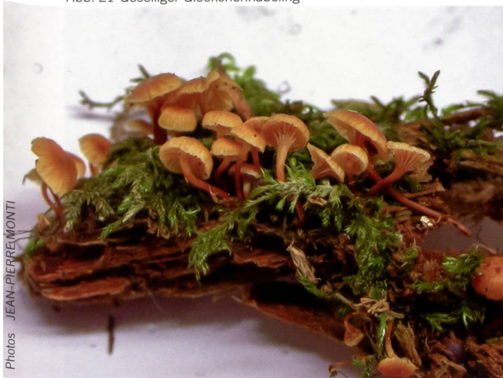
Fig. 21 Xeromphalina campanella Abb. 21 Geselliger Glöckchennabeling