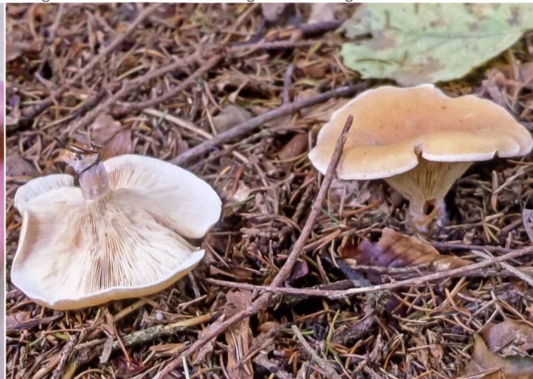
Abb. 17 Fuchsiger Rötleritterling