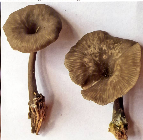
Fig. 19 Omphalina oniscus Abb. 19 Russiger Moor-Nabeling