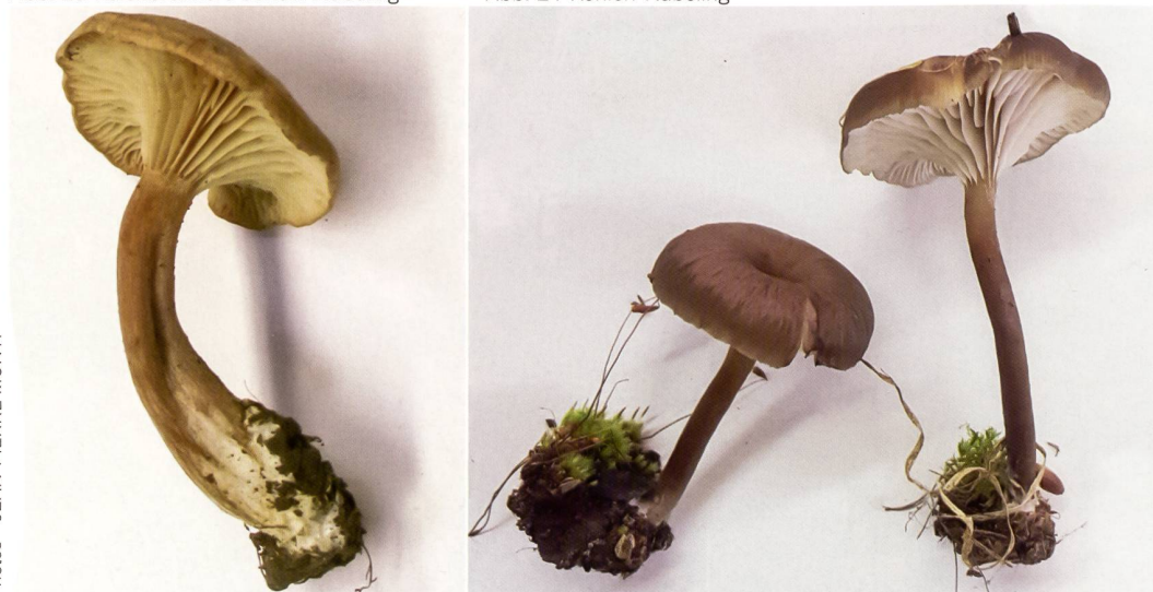
Fig. 24 Myxomphalina maura Abb. 24 Kohlen-Nabeling