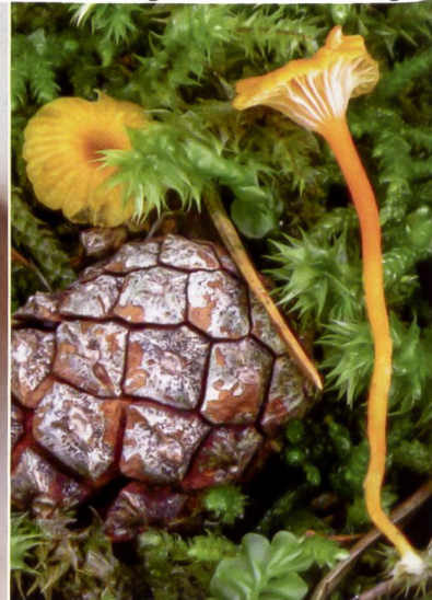
Abb. 20 Orangefarbener Heftelnabeling