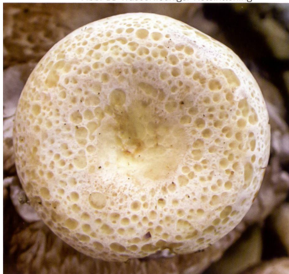
Fig. 18 Lepista gilva Abb. 18 Wasserfleckiger Rötleritterling