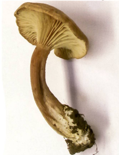
Fig. 23 Pseudoomphalina compressipes Abb. 23 Kalchbrenners Schein-Nabeling