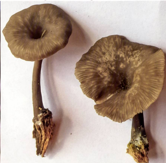
Abb. 19 Russiger Moor-Nabeling