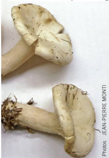
Fig. 15 Leucopaxillus candidus Abb. 15 Riesen-Krempentrichterling

Die ersten Mikroorganismen haben die Speicherung von Information in der Form von Nukleotid*-Ketten erfunden, ähnlich wie die heutigen RNS (Ribonukleinsäure) und DNS (Desoxyribonukleinsäure), also das genetische Material. Zuerst bestand es nur aus kurzen einfachen Ketten, bei deren Vervielfachung immer wieder Fehler passierten. Dieses System war also nicht sehr sicher. Das