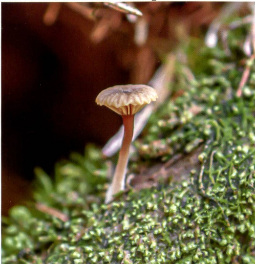
Fig. 25 Lichenomphalina umbellifera Abb. 25 Gefalteter Flechtennabeling

SMITH M. L., BRUHN J. N. & J. B. ANDERSON 1992. The fungus Armillaria bulbosa is among the largest and oldest organisms. Nature 356: 428-431.