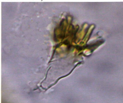
MARASMIUS TEPLICENSIS Pileozystide in Wasser | Piléocystide dans l'eau