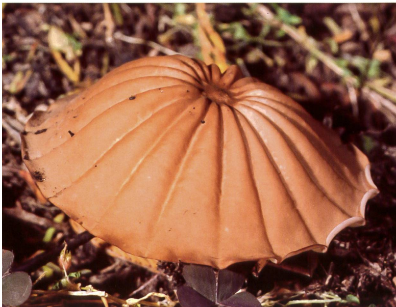
MARASMIUS TEPLICENSIS frische Fruchtkörper | fructifications fraîches