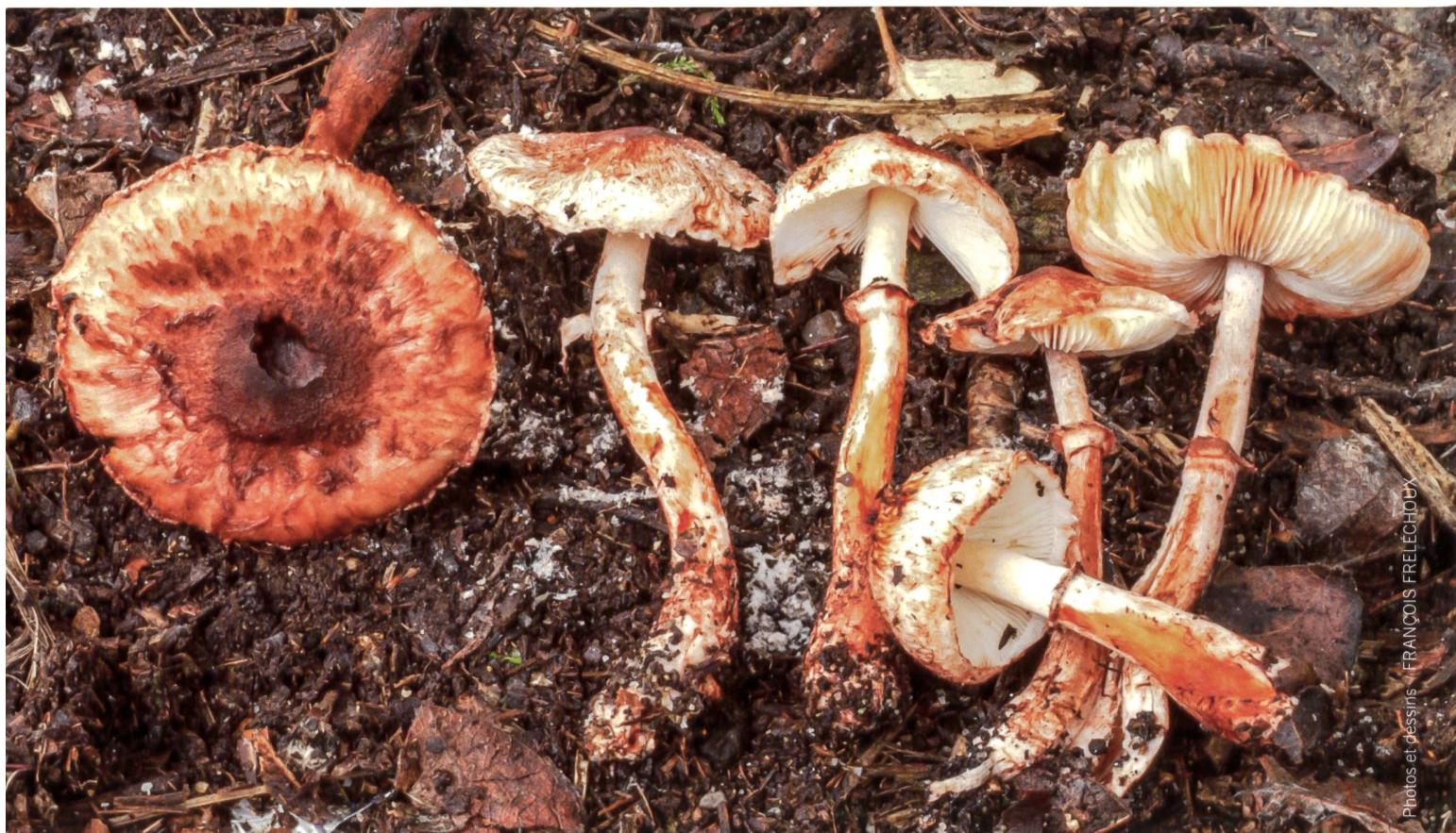
LEUCOAGARICUS CROCEOVELUTINUS Fruchtkörper | Fructifications

Identification moléculaire Un petit morceau de la fructification (environ 50 mg de poids sec) a été prélevé à partir de la récolte, lyophilisé, puis l'ADN a été extrait. En utilisant la PCR (réaction en chaîne par polymérase), la région ITS 1