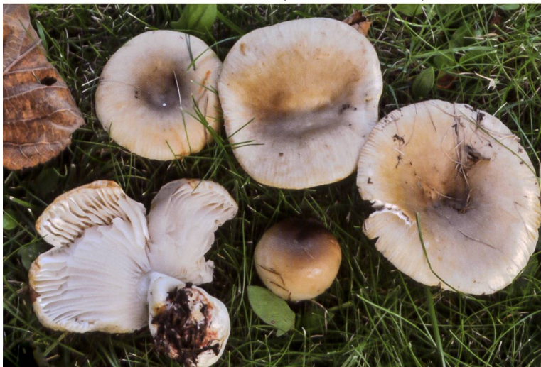
RUSSULA RECONDITA Corpi fruttiferi | Fruchtkörper