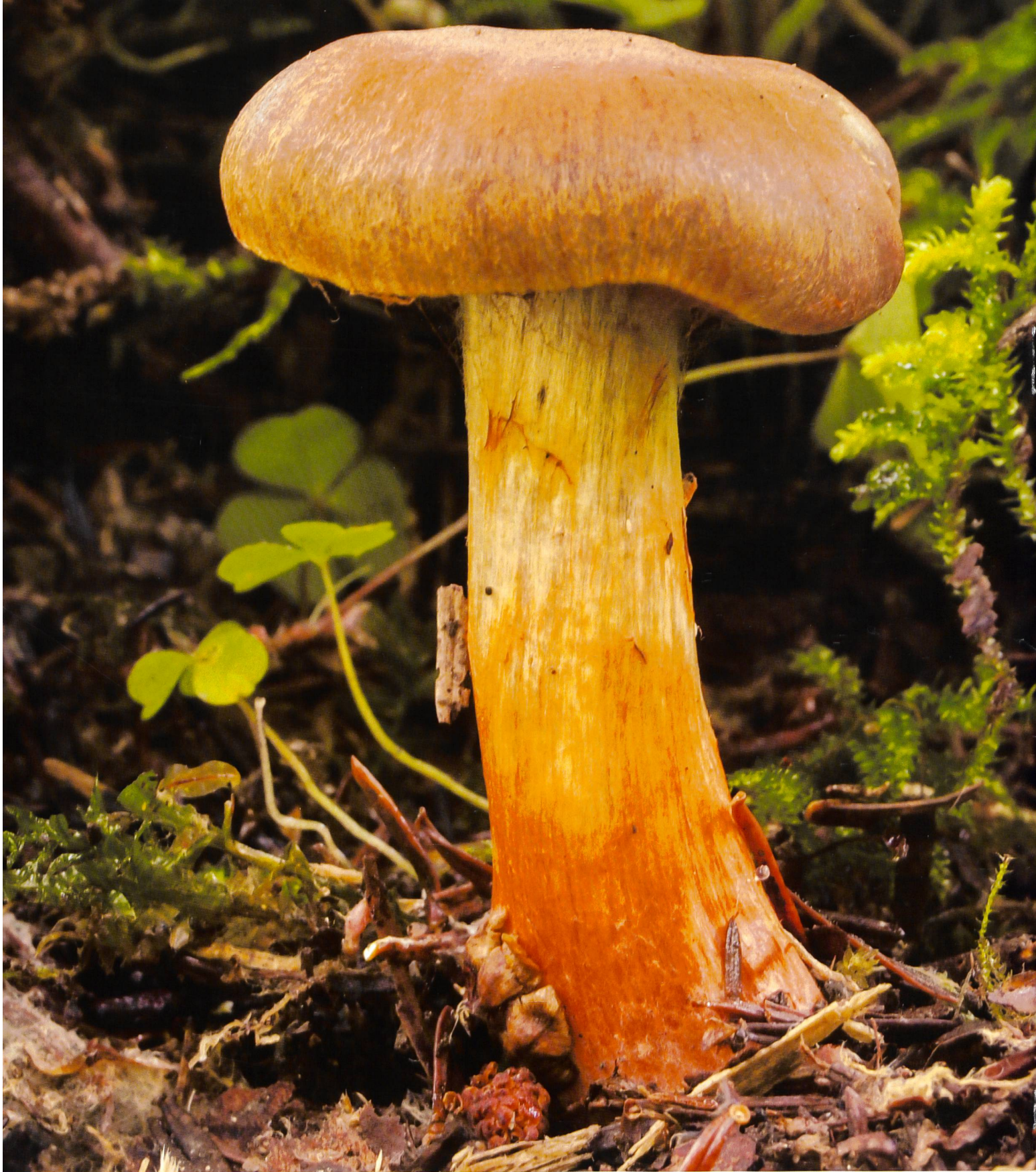
CORTINARIUS BULLIARDII Der Feuerfüssige Gürtelfuss | Cortinaire à base rouge ou C. de Buillard