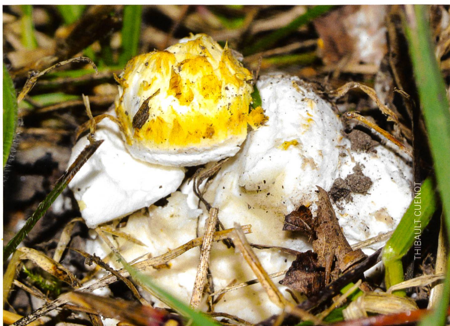
Abb. 2 Der Gelbe Schuppenwulstling, gefunden im Naturschutzgebiet Fanel im September 2018