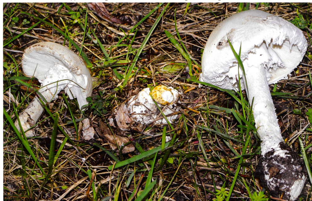
Fig. 3 SQUAMANITA SCHREIERI en compagnie de son hôte: Amanita strobiliformis Abb. 3 Der Gelbe Schuppenwulstling mit seinem Wirt dem Fransigen Wulstling

D'après SwissFungi, on a trouvé en Suisse 4 espèces, toutes très rares (entre 1 et 10 observations pour la période 1991-2018), et une 5 e est documentée par Breitenbach et Kränzlin (1995). Nous avons voulu accompagner la présente note par des planches originales dessinées à partir de différentes sources (photos d'Internet et littérature diverse).