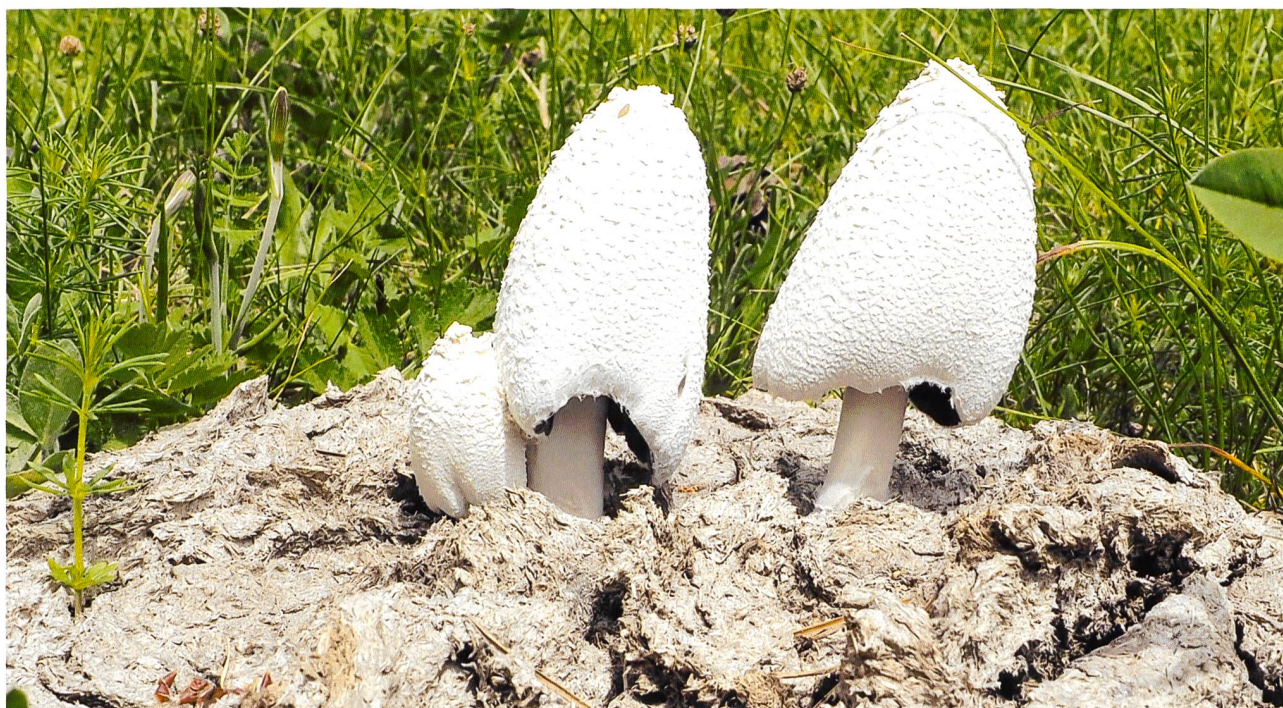
COPRINOPSIS NIVEA Schneeweisser Dungtintling | Coprin blanc de neige